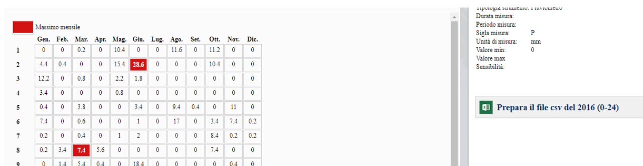
Fig. 1 – Visualizzazione tabellare dei dati richiesti, sulla destra compare il link per scaricare in formato *.csv i dati.